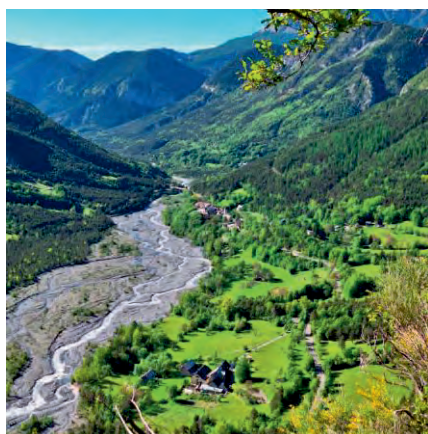
Le village et les hameaux de la rive droite du Var vus du sommet de la cascade